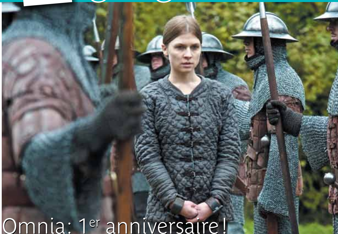
Sophie Duac Productions