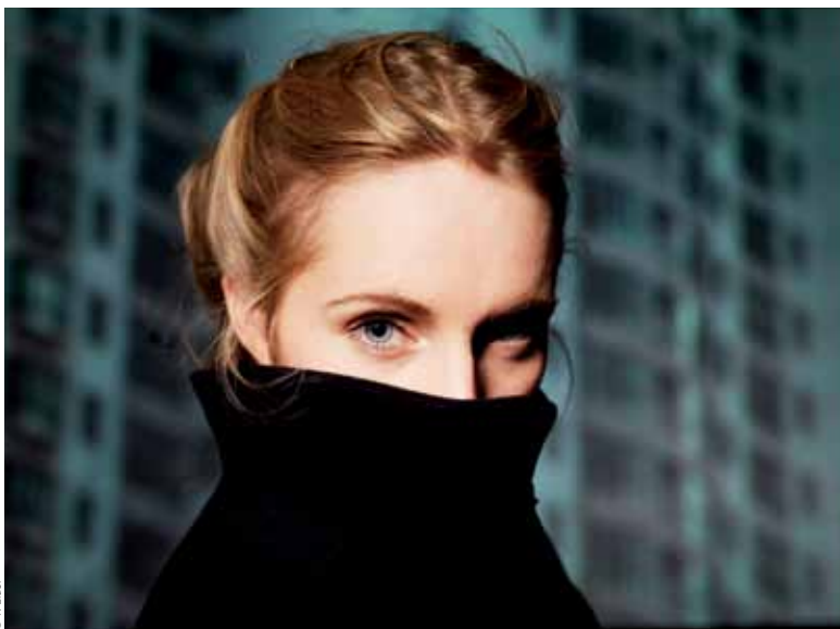
Agnès Obel, en concert au 106 le vendredi 16 septembre.

Toute la programmation des salles de cinéma sur www.rouen.fr