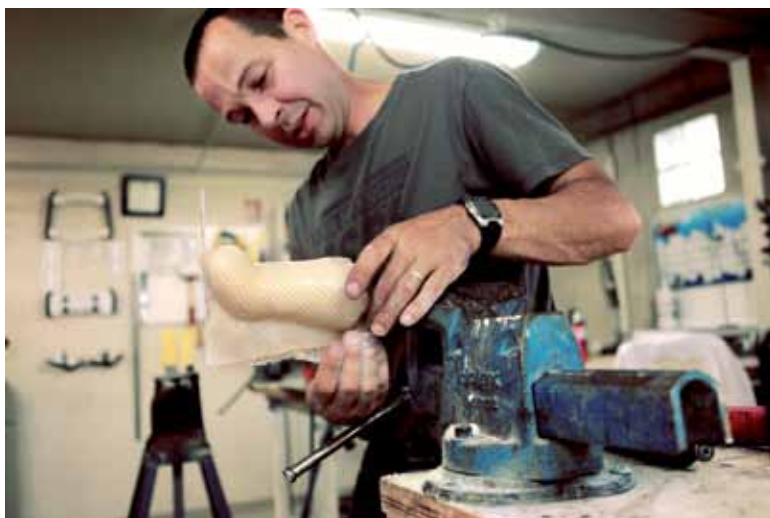
Orthéa Innovation, entreprise spécialisée dans l'appareillage pour personnes handicapées, s'implantera d'ici à décembre avenue des Quatre Cantons