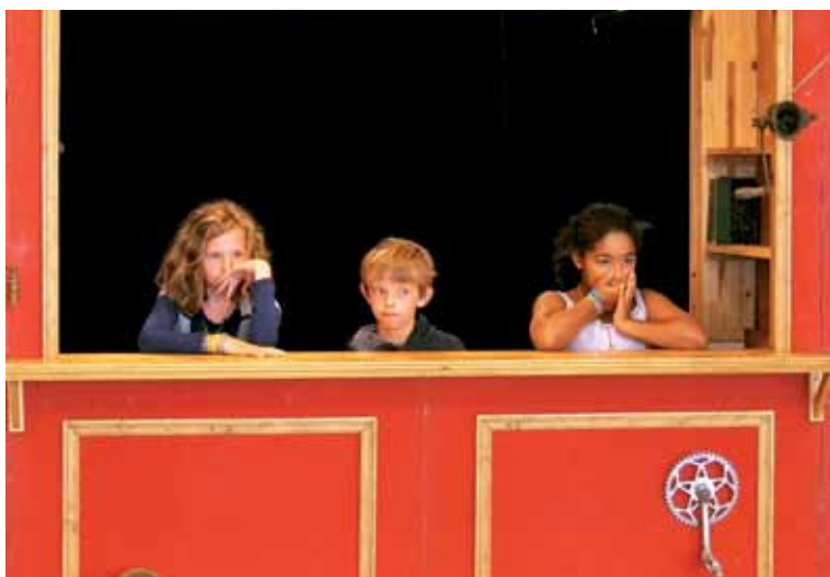
L'occasion pour les élèves de l'activité théâtre de donner au public un aperçu de leur talent.

L'extension de la maison de quartier Gaonaac'h devrait démarrer en janvier. Le manque de place n'a pas empêché la MJC Grieu de soigner le programme des 40 ans de son centre de loisirs. Le 10 septembre, une pluie d'animations reflète les projets menés à bien par le centre en 2010-2011. Une exposition présente des productions représentatives des courants artistiques abordés cette année. Une sélection de photos témoigne de la bonne santé des ateliers d'arts plastiques et de la dynamique des stages autour du spectacle vivant. Le public découvrira la vidéo Fabriquez , résultat d'une sensibilisation à l'art contemporain développée par un plasticien auprès des bénéficiaires de l'accompagnement à la scolarité. Sous un chapiteau occupant le terrain de sport, chaque