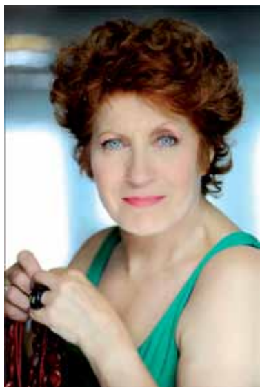
L'actrice Andréa Ferreol animera des lectures au musée Flaubert à l'occasion des journées du patrimoine le samedi 17 septembre