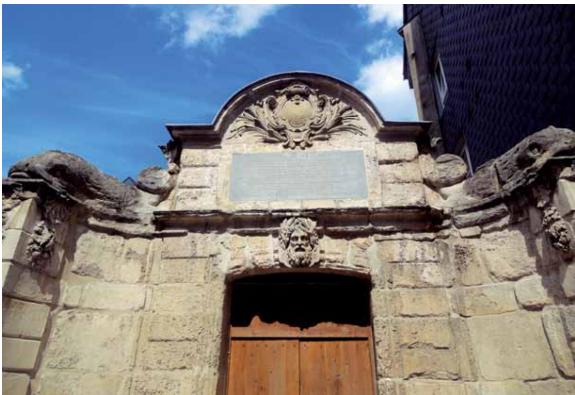
Chambre de répartition des Pénitents qui permet d'avoir un regard sur l'aqueduc de la source de Carville est classée monument historique.

Pourquoi une œuvre, un objet ou une bâtisse sont-ils classés monuments historiques ? Qu'est-ce qui les rends si remarquables ? Réponse des experts