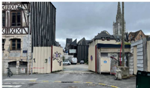
photo de l'existant avec l'ancien transformateur

En l'absence d'espace suffisant en domaine public, il est proposé de réintégrer le poste de transformation-équipement concessionnaire à vocation publique- sur une parcelle de la Ville située à proximité immédiate (parcelle DK.0464).