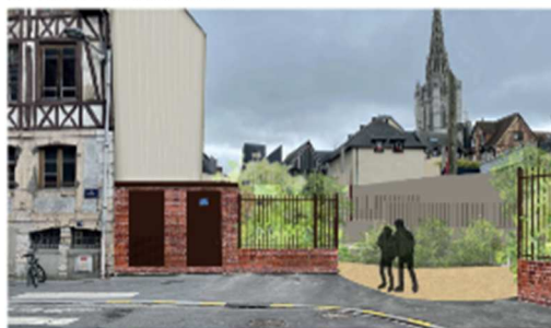
proposition du nouveau transformateur

Afin de permettre ce déplacement et la prise en charge financière des coûts inhérents par ENEDIS, une convention a été proposée par le concessionnaire réseau visant à définir le nouveau positionnement de l'équipement dans l'espace. Le financement de l'habillage reste à la charge de la collectivité.