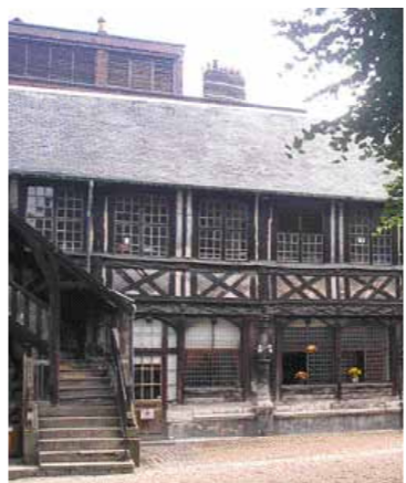
Aile Nord: état actuel

Ce bâtiment du XVII e siècle s'intègre aux galeries du cimetière par l'emploi des matériaux et par l'ordonnance générale de la façade et du décor. Cependant, il comporte dès l'origine un étage surmonté d'un comble afin d'accueillir l'école au rez-de-chaussée et le logement des prêtres à l'étage. En dépit de l'effort d'harmonisation avec l'ensemble des bâtiments, des différences apparaissent: les colonnes reposent directement sur le sol