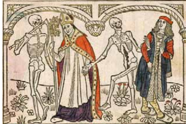
La danse macabre de Guyot Marchant représentant un évêque et un écuyer (15 e s.)