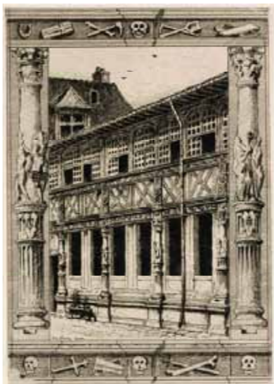
Gravure Jules Adeline (19 e s.)

L'ensemble architectural perdure jusqu'au milieu du XVIII e siècle, période durant laquelle un étage est ajouté, ce qui va complètement bouleverser les proportions des galeries. Le poids menaçant de faire affaisser les sablières, les galeries sont fermées par des cloisons en pan de bois maçonné et des fenêtres. Trois escaliers (celui du sud a été démolé en 1911) sont construits aux angles de la cour pour communiquer avec le nouvel étage. L'ossuaire est également comblé.