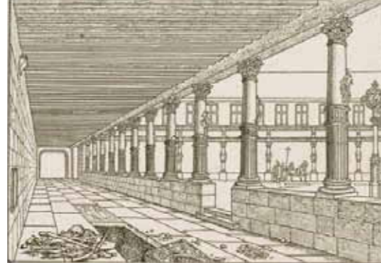
Vue de la galerie Ouest de l'Âitre Saint-Maclou (gravure E.H. Langlois, 19 e s.)