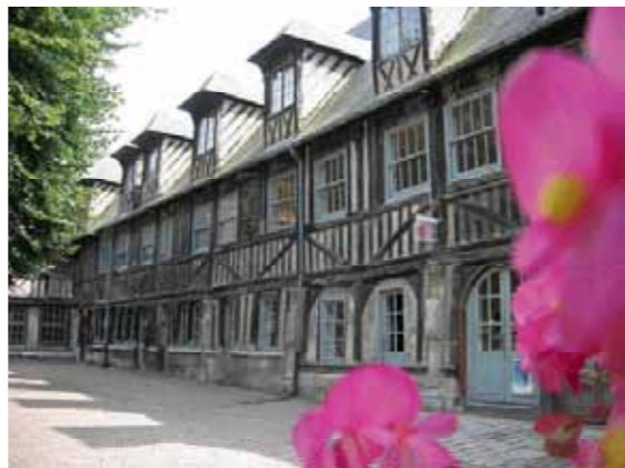
Vue du bâtiment Sud