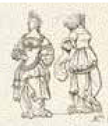
Couple de Sibylles, galerie Nord (gravure Langlois, 19 e s.)

Quant aux chapiteaux des colonnes, beaucoup mieux conservés que l'ensemble du décor sculpté de l'aître, l'influence italianisante se mêle au décor médiéval qui orne si souvent les manuscrits. Tout un univers hybride constitué de fantaisies décoratives de l'Antiquité (sphinges*, satyres, amours) et de décors médiévaux (têtes en forme de feuilles, buste d'homme à longue barbe coiffé d'une toque, têtes grimaçantes) évolue dans un environnement végétal et d'éléments empruntés à l'Italie du Nord (cornes d'abondance, candélabres*).