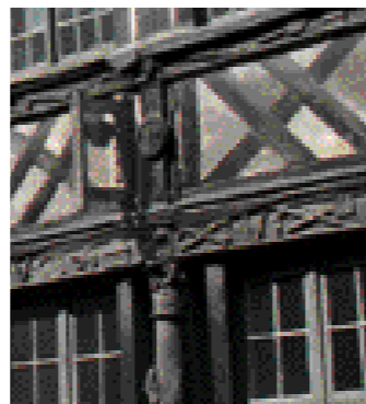
Le portant de bois de la cloche (aile Nord)

En 1862, le monument est classé et protégé au titre des monuments historiques, reconnaissance de son intérêt historique et architectural. Aux écoles chrétiennes, succède en 1911 un pensionnat de jeunes filles. À sa fermeture, les bâtiments sont laissés dans un état de semi-abandon puis mis en vente. L'Âitre Saint-Maclou devient en 1927 propriété de la Ville de Rouen qui projette d'y installer un musée d'art normand. En 1930, des travaux d'aménagement y sont entrepris. Pourtant, les bâtiments n'auront pas d'affectation précise