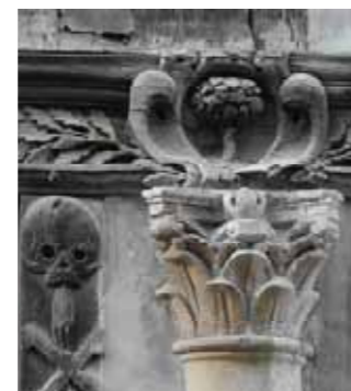
Armoiries de Robert Duchesne (aile Sud)

Près de l'actuelle entrée, le portant de bois d'une cloche rappelle la vocation scolaire de l'âitre. En effet, au milieu du XIX e siècle, un nouveau bâtiment fermant au sud la cour du cimetière, est édifié suite à un legs du prêtre Robert Duchesne (dont les armes sont sculptées sur la façade). Il abrite une école pour les garçons pauvres du quartier bien que le cimetière soit toujours en fonctionnement. Au XVII e siècle, les Frères des écoles chrétiennes fondées par saint Jean-Baptiste de la Salle prennent la direction de l'école. Les galeries servant d'ossuaire sont transformées de 1745 à 1749 pour accueillir des salles de classe. Les Frères restent jusqu'en 1907, à l'exception de la période révolutionnaire (1792-1819), où l'âitre est affecté à diverses fonctions: société de filature, fabrique d'armes, club révolutionnaire. En 1779, suite à une ordonnance royale, le Parlement de Normandie ordonne la suppression des lieux de sépulture urbains. Le cimetière Saint-Maclou est fermé en 1781, remplacé par celui du Mont-Gargan situé hors la ville.