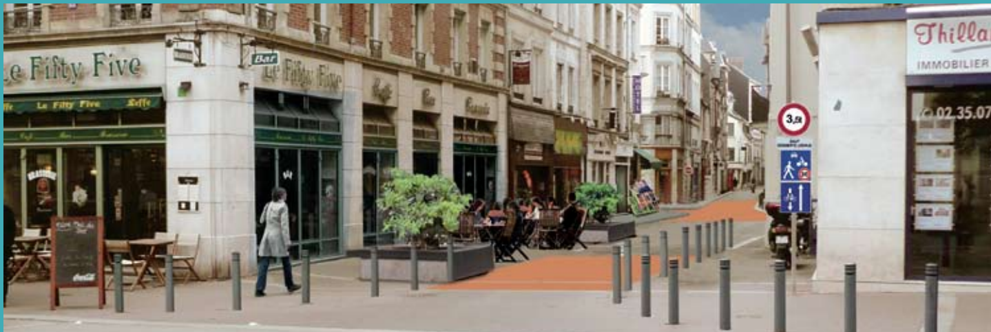
Rue des Bons Enfants : Projet de zone de rencontre en cours de réalisation.

conseil de quartier a de nouveau interpellé la municipalité. Que faire? Dans un premier temps, avec la mise en place de bacs de regroupement pour les ordures ménagères, la rue a gagné en propreté sans pour autant améliorer une bonne fois pour toutes son image et son cadre de vie.