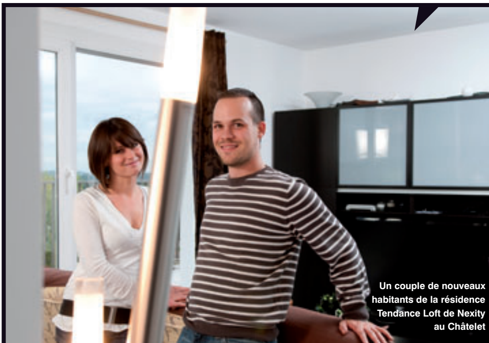
Un couple de nouveaux habitants de la résidence Tendance Loft de Nexity au Châtelet