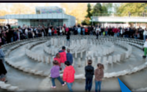
L'inauguration du Plot HR , résidence de l'École Régionale des Beaux-Arts, a eu lieu le 16 octobre dans une cascade de bonne humeur autour de la proposition de l'artiste Vincent Ganivet.

Enfin, les travaux se concentreront de l'autre côté de la rue Galilée où seront réaménagés de nouveaux espaces de stationnement intégrant une placette, des arbustes et des bancs.