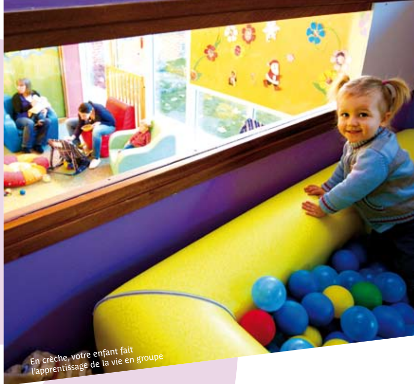
En crèche, votre enfant fait l'apprentissage de la vie en groupe

Capacité d'accueil : 12 places d'accueil occasionnel