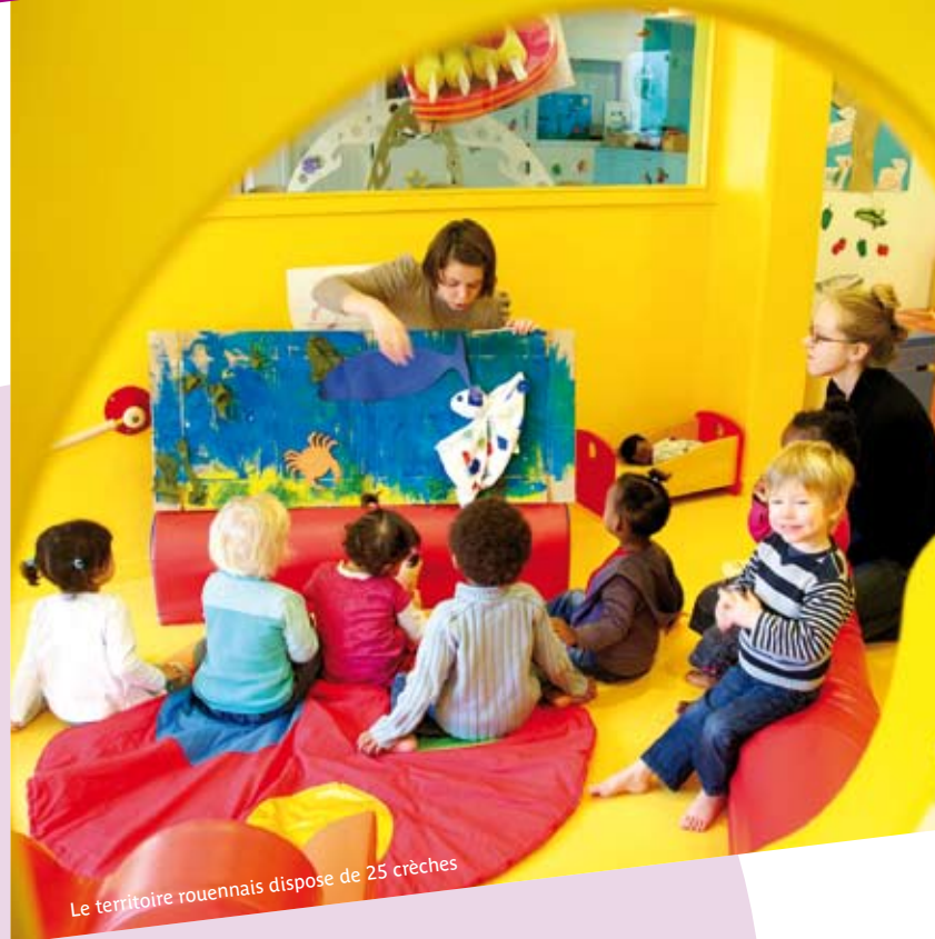
Le territoire rouennais dispose de 25 crèches