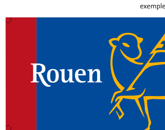
Pavillon : 2 formats : 1• l=1000 mm, h=1500 mm 2• l=2000 mm, h=3000 mm échelle 10% du format 1

L'utilisation de ces 3 versions est exclusivement réservée à ces usages.